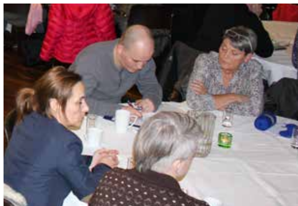
Frá álitisfólkafundum í Starvsmannafelagnum á Hotel Føroyum

Starvsmannafelagið hevur fleiri ráðgevar, við ymsum førleikum, knýttar at felagnum. Nú ber til at fara inn á heimasíðu felagsins www.starvsmannafelag.fo og skriva til viðkomandi ráðgeva, um tú hevur onkran fyrispurning, sum viðkoma tínum starvi – sosialum viðurskiptum, eftirløn ella lögfrøðiligum málum. Á forsíðuni til vinstru er mynd av ráðgevonum, har kanst tú fara inn, og velja tann ráðgevan, tú metir kann svara tínum fyrispurningi. Fyrispurningarnir verða viðgjørdir í trúnaði.