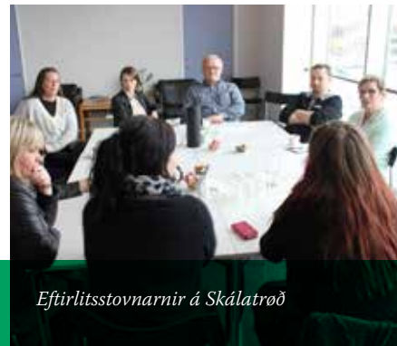
Eftirlitsstovnarnir á Skálatrøð