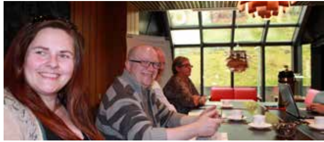
Umboðini fyri Starvsmannafelagið, tá ið krøvini vóru handað í Fíggjarmálaráðnum