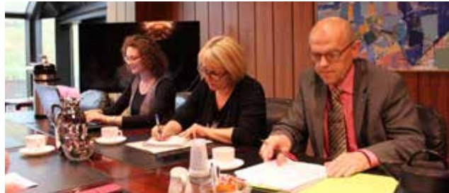
Umboðini fyri Fíggjarmálaráðið.