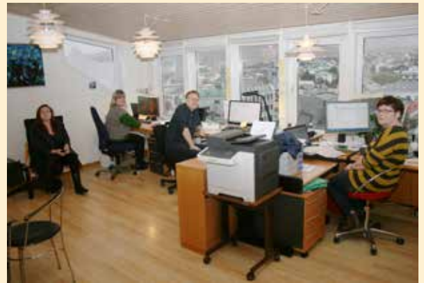
Meðan umbyggingin fer fram húsast umsitingin á Tinghúsvegi 15.