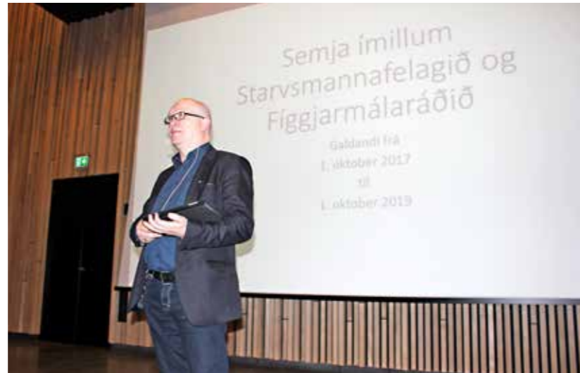
Smæran 13. oktober í fjør. Súni Selfoss leggur uppskotið til semju við Fíggjarmálaráðið fyri álitisfólkini í Starvsmannafelagnum. Nýggi sáttmálin varð undirskrivaður seinni sama dag.

Tíðliga í 2017 varð lønarnevndin endiliga mannað. Ætlanin var, at hon skuldi verða komin væl áleiðis, áðrenn