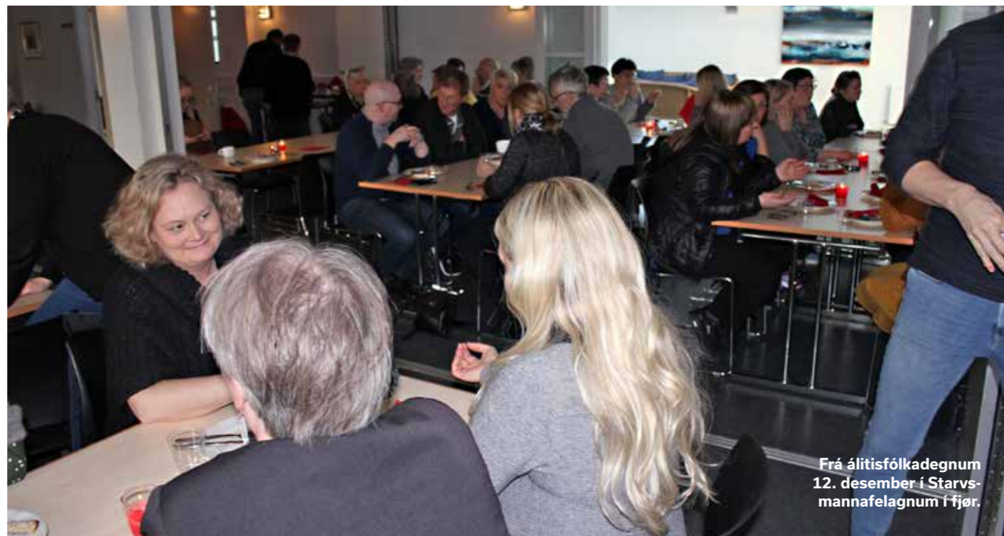
Frá álitisfólkadegnum 12. desember í Starvsmannafelagnum í fjør.

Summir almennir stovnar hava eisini líknandi starvsfólkaumboðan í leiðsluni. Dømi um hetta eru stýrið fyrri Kringvarp Føroya og stýrið fyrri Fróðskaparsetrið.