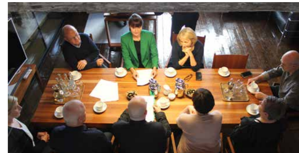
Semjan við Fíggjarmálaráðið varð undirskrivað í Tinganesi 13. oktober í fjør.

At siga, at hettar at vit fáa staðfest í sáttmálan, at tað er í Tryggingarfelagnum LÍV, vit hava okkara eftirløn- og samlagstryggingar, er kappingaravlagandi, er at tala móti betri vitan. /