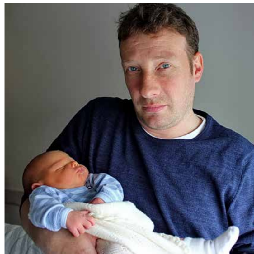
Myndin varð tikin á barnadeidini á landssjúkrahúsinum, í sambandi við verkætlanina hjá Starvsmannafelagnum „12 Kjarnumál“ í valárinum 2015, har betri barsilsrættindi vóru eitt av málunum.

Í fyrsta umfari er tað bert sáttmálin við Fíggjarmálaráðið, sum er broyttur. Sáttmálin við kommunurnar var ikki gjørdur, tá Starvsblaðið fór til prentingar. Sannlíkt er tó, at rættindini hjá kommununum verða tey somu sum hjá landinum. Eisini er málið, at fáa somu rættindi í sáttmálarnar fyri tey almennu partafelagini Posta og Føroya Tele.