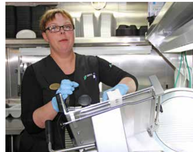
Øll amboð og køkurin sjálvur skulu sjálvandi gerast rein hvønn dag eftir nýtslu.

Nærliggjandi er at spyrja, um hon ongantíð hevur hugsað um at gevast