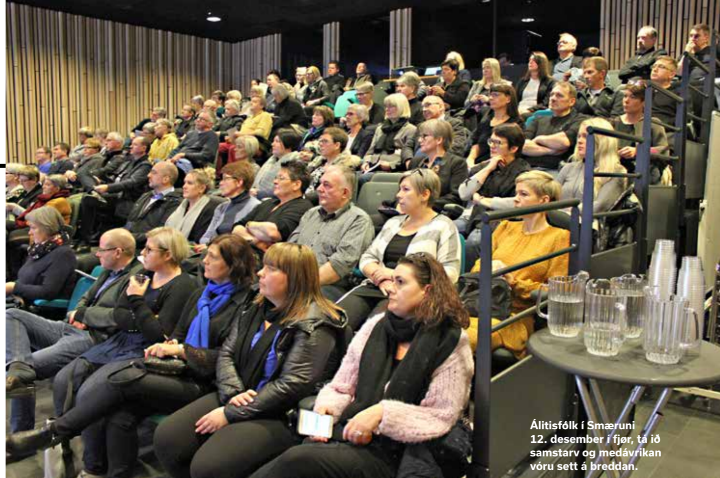
Álitisfólk í Smæruni 12. desember í fjør, tá ið samstarv og medávirkan vóru sett á breddan.

Fýra spurningar vórðu settir, sum tóku støði í orðingunum í § 2 í sáttmálunum um kunning og medávirkan á arbeidsplassunum, tá broytingar henda. Í onkrum einstøkum føri hava álitisfólkini ikki svarað øllum spurningunum. /