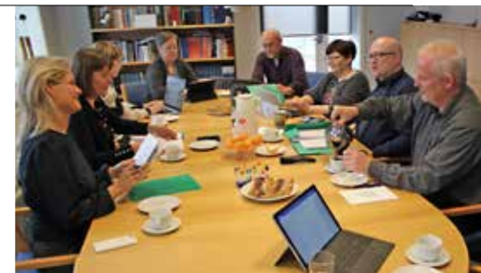
Samráðingarfundur í Starvsmannafelagnum.

Hetta var sjálvandi ein nýggj støða hjá Kommunala Arbeidsgevarafelagnum, sum bað um útsetan, so tey kundu seta seg inn í nýggju støðuna. Síðani fór Pedagogfelagið í verkfall og varð rakt av verkbanuni. Hetta gjordi so, at samráðingarnar aftur blivu settar í bíðistøðu.