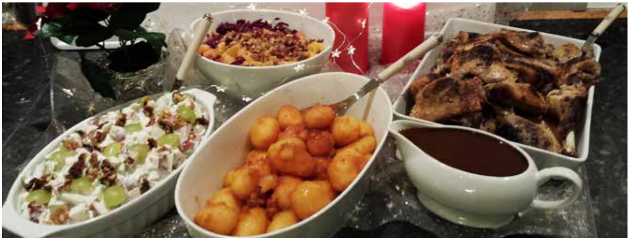
Dunna, brún epli, reyðkálsalat og waldorfsalat