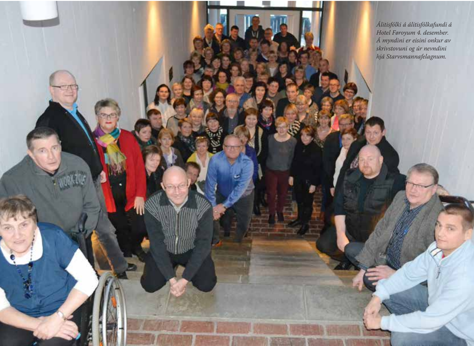
Álitisfólki á álitisfólkafundi á Hotel Føroyum 4. desember. Á myndini er eisini onkur av skrivstovuni og úr nevndini hjá Starvsmannafelagnum.