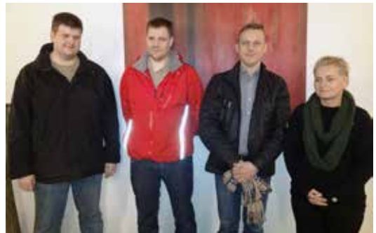
Ein av teimum mest virknu fakkbólkunum eru tey í KT-bólkinum

Felagið rindar hvørjum bólki eina byrjunarupphædd á 15.000 kr. og síðani, tá bólkurin er komin í gongd, og fyrsti roknskapur latin felagnum, verða 100kr pr. lim í bólkinum latin einaferð árliga.