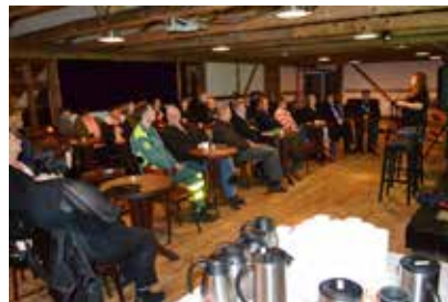
Eftir at umboðini fyri Starvsmannafelagið høvdu hitt fólk á arbeiðsplássunum skipaði felagið fyri kvøldsetu á Seglloftinum

limunum aðrastaðni, og at hetta krevur serligar loysnir.