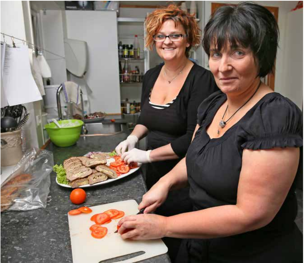
Hansa og Vagna hava úr at gera