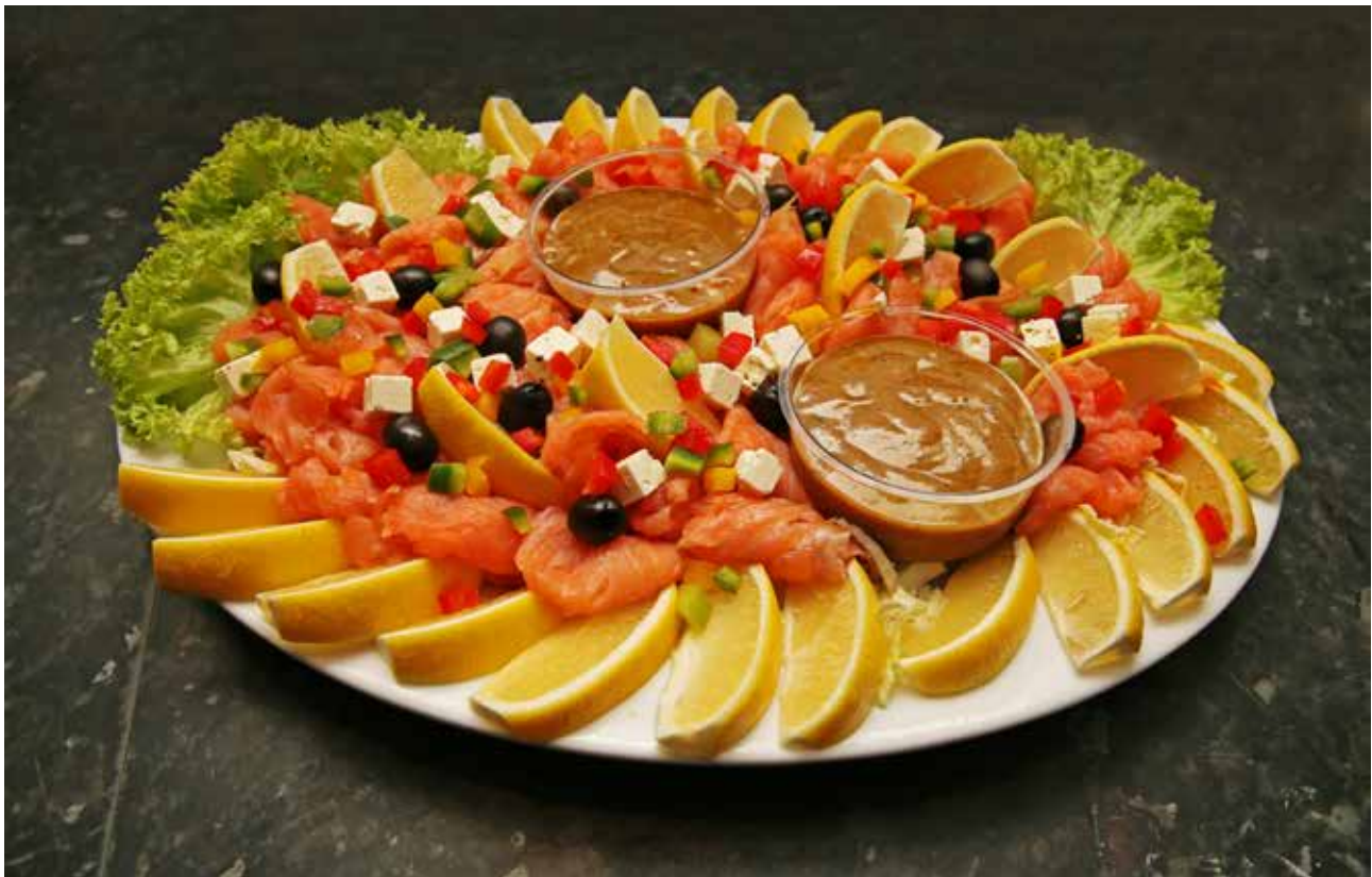
Laksafat við dild dressingi