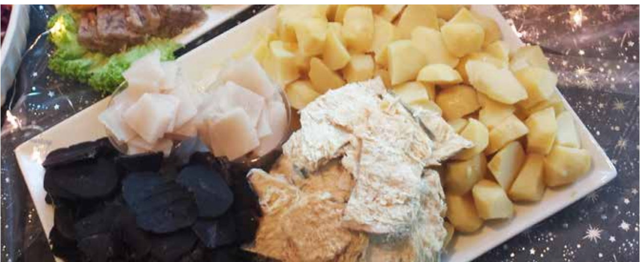
Tvoft, spik og turrur fiskur