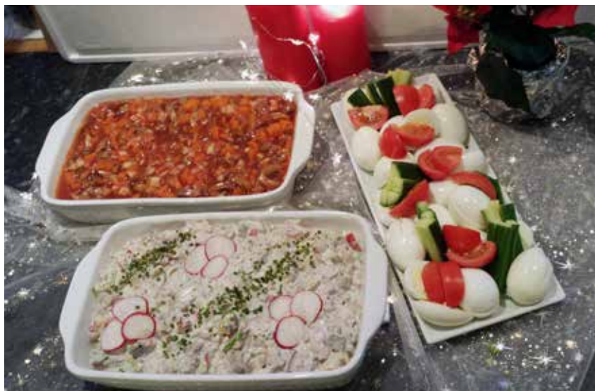
Sildasalat og kryddsild

Hesa tænastu hevur Hansa alt árið og kann bjóða alt, sum fólksins hugur stendur til at borðreiða fyrri fólk. Hansa sigur, at vanliga eru tað buffét og trýrættarmatskráin, fólk ynskja, men so mangt annað er eisini møguligt, m.a. grýturættur, smyrjibreyð, tvíflísar og suppur. Ynskini eru so ymisk, men til jóla tykjast fólk at vera rættiliga síðbundin við dunnu, sós og reyðkáli ovast á breddanum, saman við nógvum øðrum, sum fólk ynskja sær til jólaborðhaldið. Starvsblaðið fekk loyvi til at síggja nakað av tí, sum fólk serliga biðja um til hesa høgtíð.