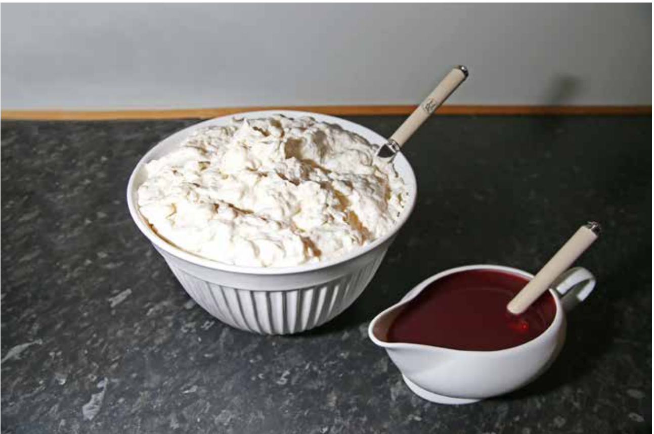
Rís ala Mandle