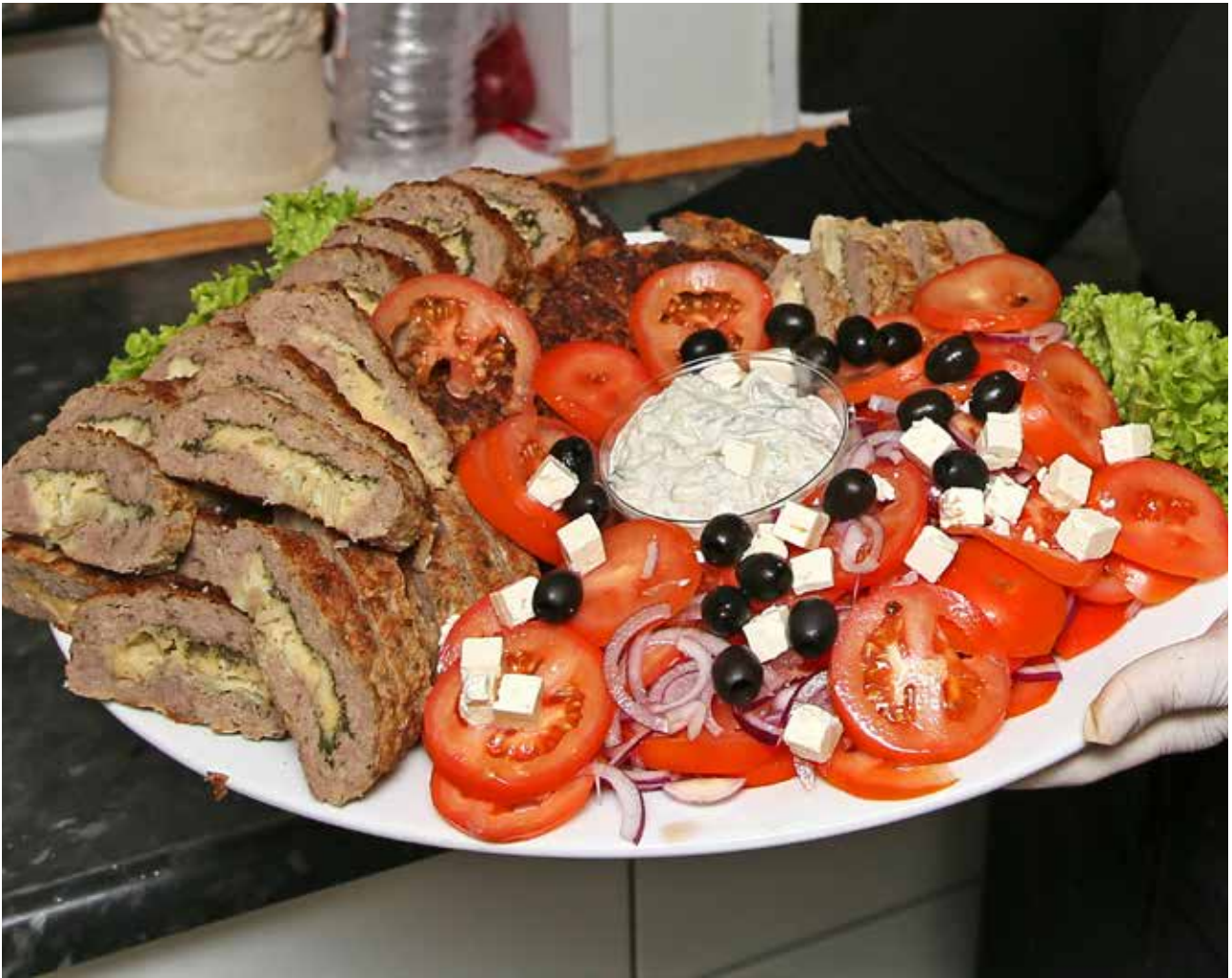
Italiensk kjotrulla við tomatasalati