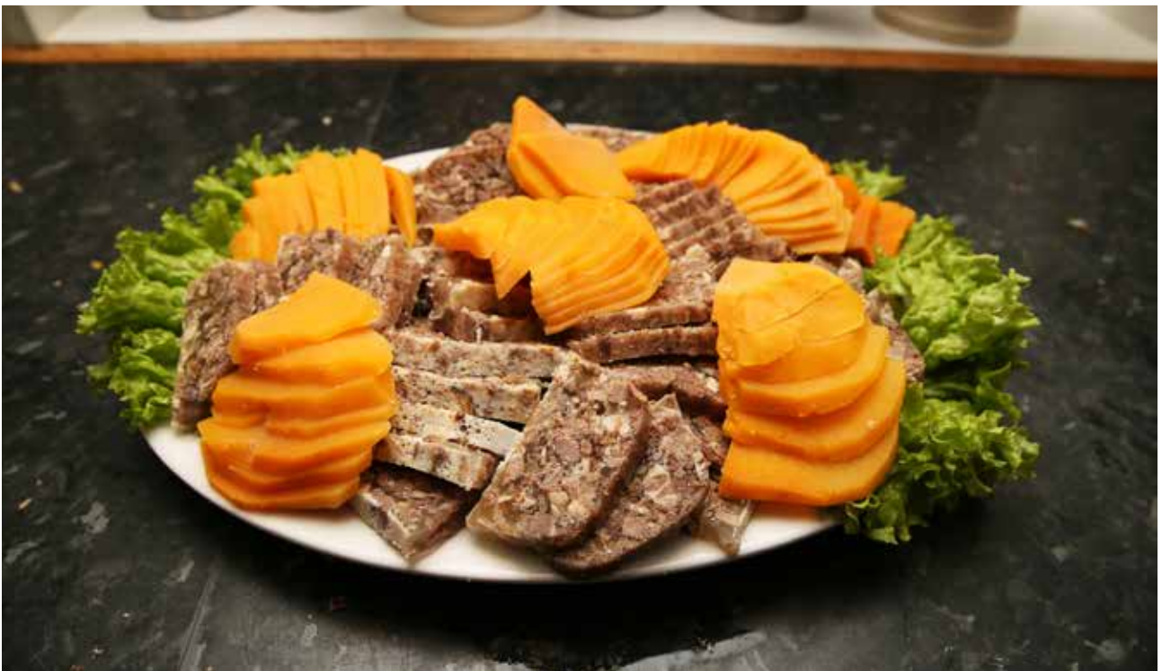
Ræstkjotasúlta og kókaðar rotur