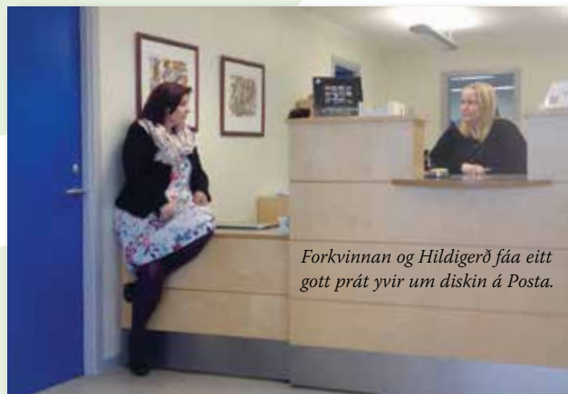
Forkvinnan og Hildigerð fáa eitt gott prát yvir um diskinn á Posta.