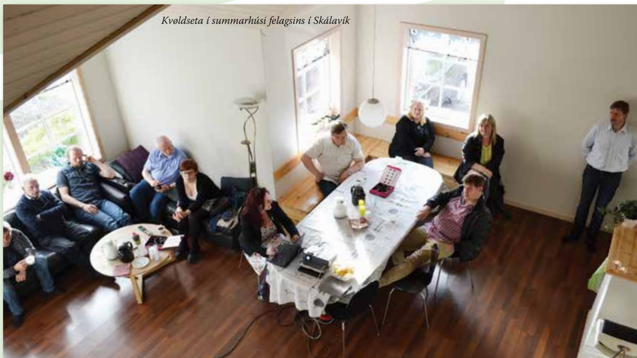
Kvoldseta í summarhúsi felagsins í Skálavík