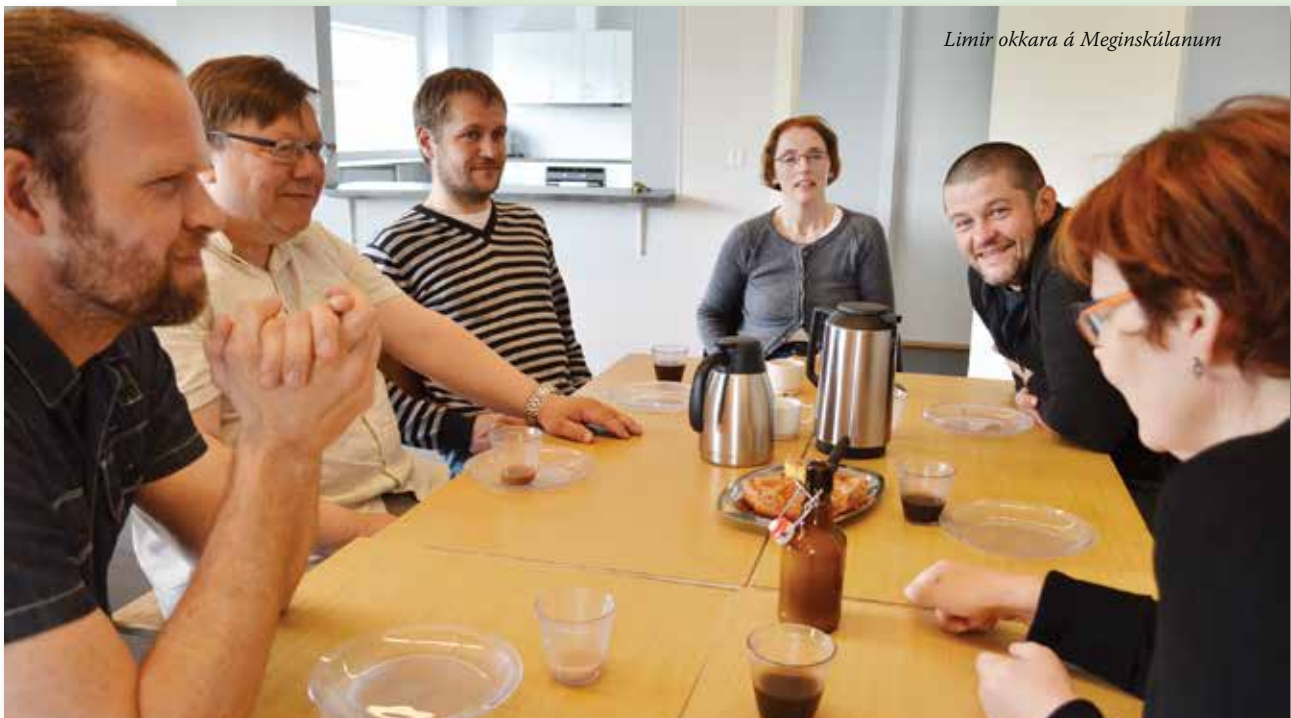
Limir okkara á Meginskúlanum

Samanumtikið var hetta eftir okkara meeting ein væleydnaður dagur, og síggja vit stóran týdning í at fáa sett andlit á limir okkara.