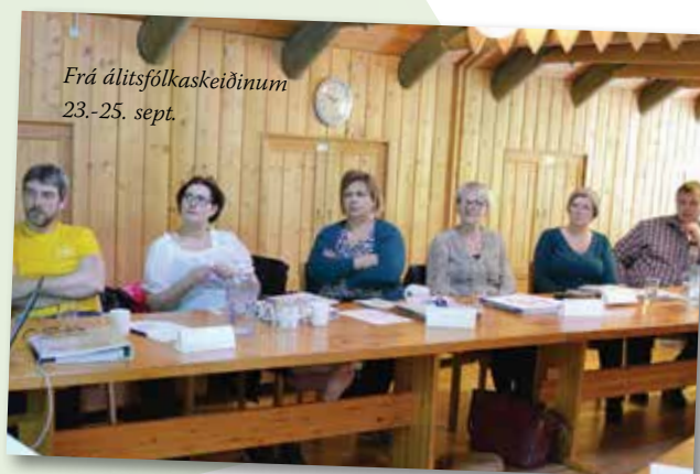
Frá álitisfólkaskeiðinum 23.-25. sept.

Vit vóna at álitisfólkini hava fingið nakað burtur úr skeiðunum, og ynskja okkara álitisfólkum góða eygnu í teirra arbeiði framyvir.