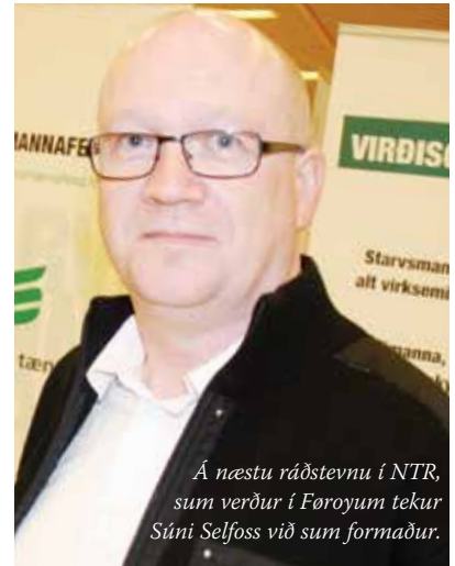
Á næstu ráðstevnu í NTR, sum verður í Føroyum tekur Súi Selfoss við sum formaður.

Nordisk Tjenestemansrád umfatar norðurlenskt samstarv millum fakfeløg. Felagsskapurin, sum telur 320.000 limir, hevur næsta ársfundin í Føroyum.