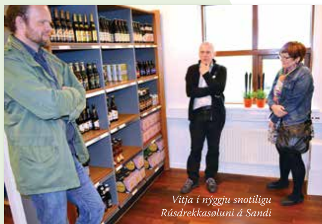
Vitja í nýggju snotiligu Rúsdrekkasoluni á Sandi