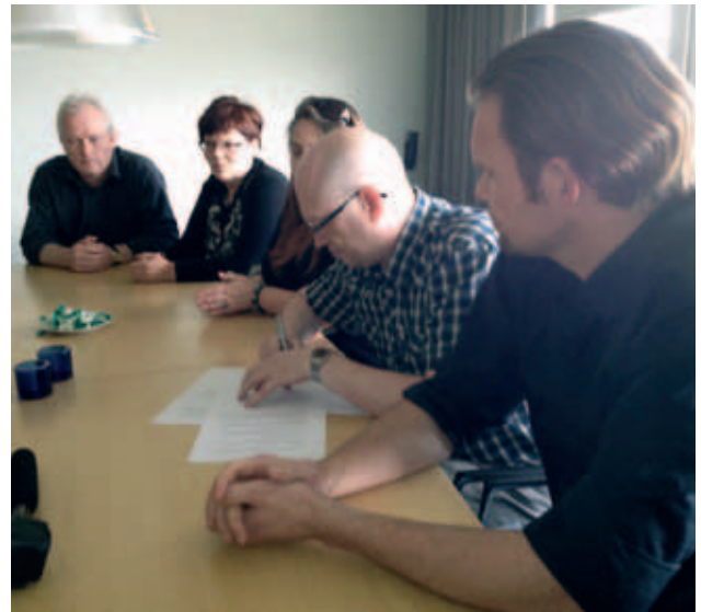
Sáttmálin verður undirskrifaður