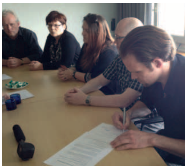
Starvsmannafelagið fyrirleikaði seg væl ... – og tað gav úrslit

1. oktober 2014 hækka mánaðarløninar aftur við 1,9 %-um.